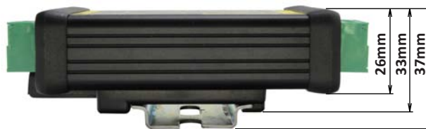
Pohľad z boku s pripevnenou DIN lištou